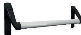
Barra Tecno (opcional)