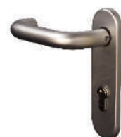
Manilla M1 INOX